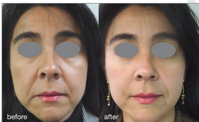
Fotona4D® procedure: courtesy of Adrian Gaspar, MD

"Together, these unique four laser modalities provide a full thickness penetration laser treatment that can really impress. You can treat superficially as well as down to the dermis, provide volumetric bulk heating, and then plump from the inside at just the right location for a synergistic effect. You get great results in one session, although as with other therapies, additional sessions provide additional improvement."