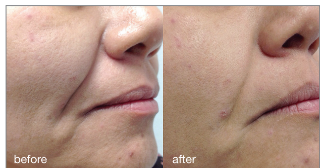
Fotona4D® procedure: courtesy of Adrian Gaspar, MD

En helt kall laserablation avslutar Fotona4D® protokollet och ger huden en vacker lyster.